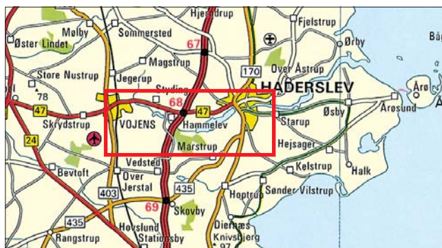
Udgivet i 1995. Genoptrykt i 2000

Amtets naturvejleder arrangerer ture og står til rådighed med forslag og ideer til aktiviteter. Naturvejlederen træffes tirsdag kl. 13-16, tlf. 74 33 55 61.