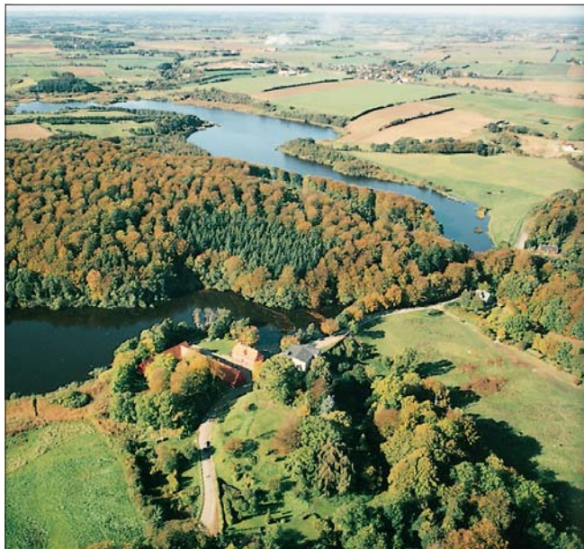
Tørning Mølle og Stevning Dam

Fra små bække samles vandet i tunneldalens mange vandløb, som ender i Tørning Å. Siden middelalderen har man ved opstemning af åen udnyttet vandet til at drive forskellige former for mølleri ved Tørning, Christiansdal og Haderslev. Det er disse opstemninger af vandet, der har skabt søerne, Stevning Dam og Haderslev Dam.