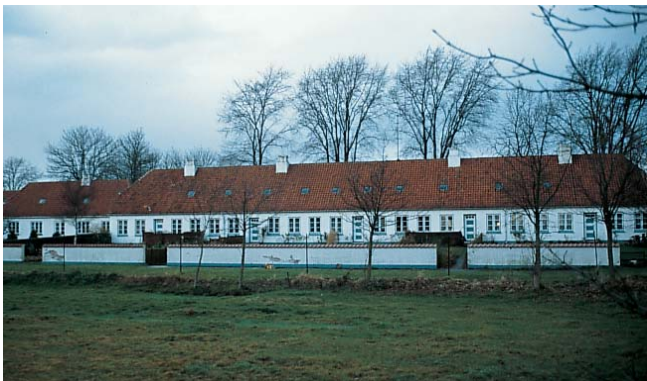
Arbejder- og håndværkerboliger